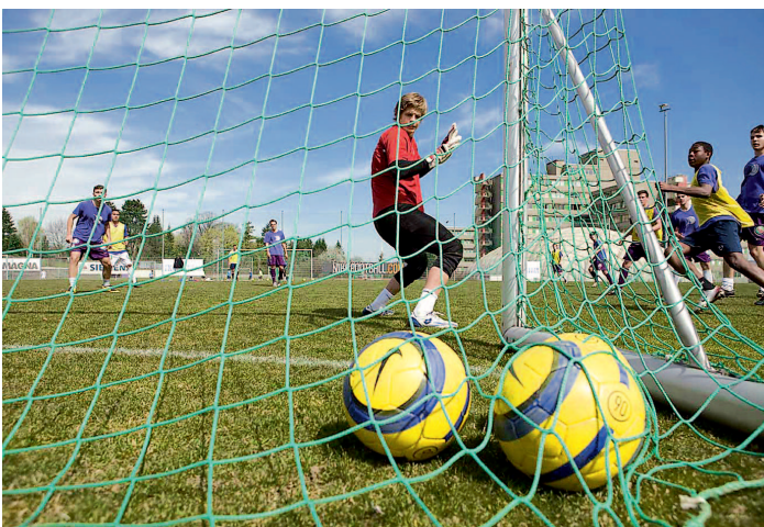
Die Infrastruktur der ehemaligen Frank Stronach-Fußballakademie bringt's!