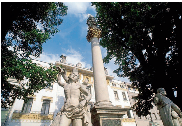
Überschaubare Metropole im westlichen Weinviertel: Hollabrunn hat Flair

IMPRESSUM: Medieninhaber, Herausgeber und Verleger: Mediaprint Zeitungs- und Zeitschriftenverlag Ges. m. b. H. & Co. KG, Muthgasse 2, 1191 Wien. Projektleitung und Anzeigenannahme: Gerhard Krejci, ☎ +43 1 2266 64 631, gerhard.krejci@mediaprint.at ; Redaktion: Andreas Leisser, ☎ +43 1 36 000 3042, andreas.leisser@mediaprint.at . Grafik und Layout: Alfred Walenta, ☎ +43 1 36 000 3093, alfred.walenta@mediaprint.at . Hersteller: LEYKAM Let's Print, Bickfordstraße 21, 7201 Neudörfel.