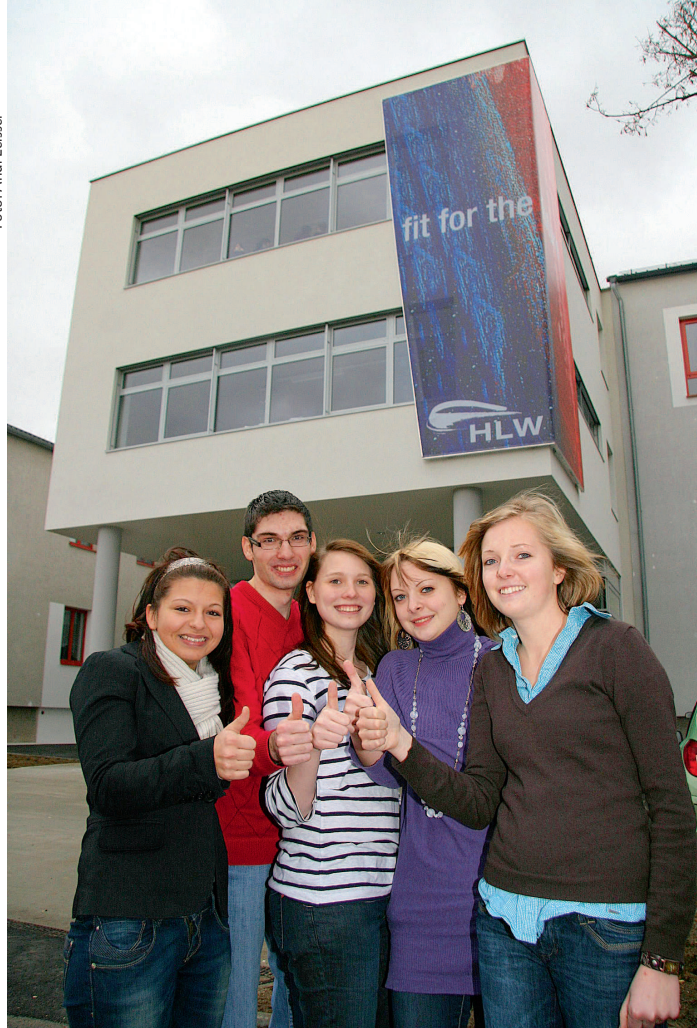
HLW Hollabrunn: Fit for the Future – in drei oder fünf Jahren!

Auch die SchülerInnen der 3-jährigen Fachschule mit dem Schwerpunkt Gesundheit und Soziales erfahren umfassende Ausbildung, die vom allgemeinbildenden über den Englisch- bis hin zum fachpraktischen Unterricht reicht. Seit letztem Schuljahr ist es auch in der Fachschule möglich, zwischen 2. und 3. Klasse ein zweimonatiges Pflichtpraktikum zu absolvieren.