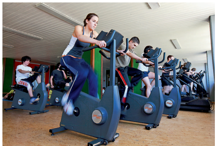
Nicht nur in der Stadt – auch im Gebäude gibt es viele Freizeitangebote