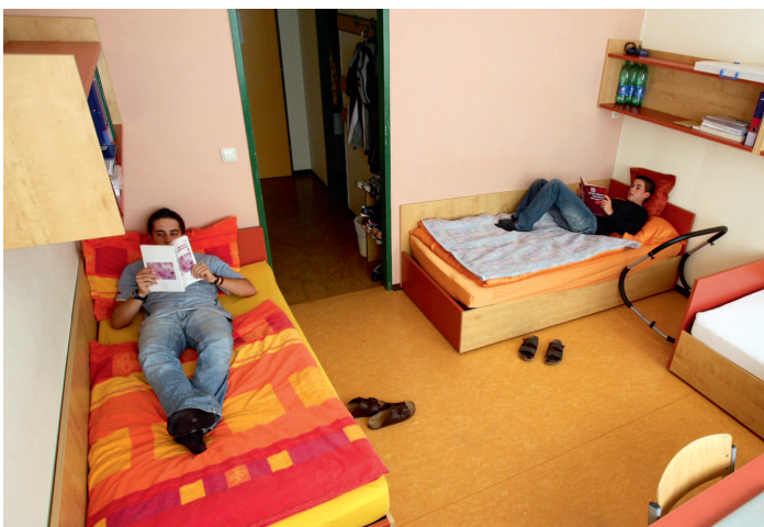
Gemütliche 2- und 3-Bett-Zimmer schaffen angenehmes Lernklima