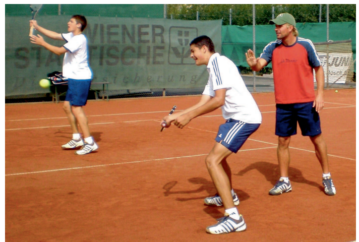
Sportlicher Ausgleich zum vielfältigen Bildungsangebot auf hohem Niveau