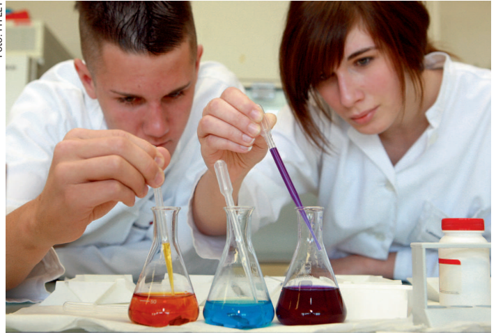
Fundierte Ausbildung mit Top-Chancen: HTLLT-Abgänger sind gefragt!

Praxis spielt in der Lebensmitteltechnologie freilich eine große Rolle